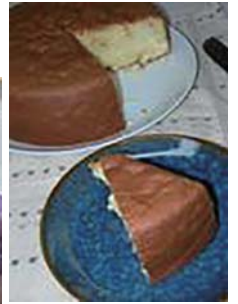
カステラ風 梅ケーキ

※料理の詳しい作り方については、はこべの家のHPに掲載しておりますので、ぜひご覧ください。