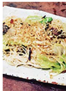
へしこそうめん チャンブル