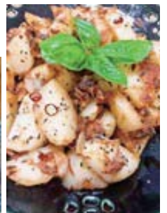
へしこの アリオアリオ

※料理の詳しい作り方については、はこべの家のHPに掲載しておりますので、ぜひご覧ください。