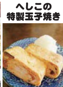
へしこの 特製玉子焼き