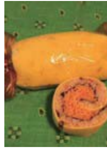
オムそば巻き 梅風味